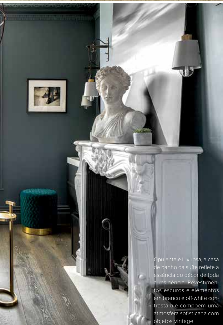
Opulenta e luxuosa, a casa de banho da suíte reflete a essência do décor de toda a residência. Revestimentos escuros e elementos em branco e off-white contrastam e compõem uma atmosfera sofisticada com objetos vintage

O banho auxiliar traz uma estética P&B e elementos vintage, como o lustre e a banheira. Objetos metalizados mantêm a atmosfera neutra e luxuosa do espaço-destaque para as cabeças de cervo, Graham and Green, na parede. No último nível, dois quartos de hóspedes duplos, e um banho completam a morada. Toda a residência traz uma atmosfera suave e sofisticada. A paleta neutra destaca as texturas dos revestimentos e as escolhas irreverentes dos objetos de décor. Um projeto que preza pela elegância em seus mínimos detalhes. ■